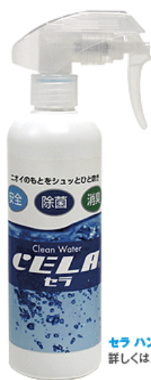
セラ ハンディースプレー 詳しくはこちら>>

ノロウイルス、インフルエンザウイルス等の直接感染・飛沫感染予防に!! モノや室内空間で、人に肌にやさしく、モノにやさしく 安心・安全にご使用していただける 安心・安全 次亜塩素酸 除菌・消臭水「CELA(セラ)」が有効です。