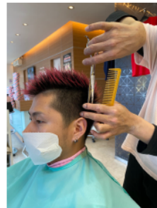
お客さまへの安全マスク例